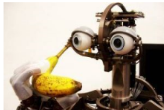
Roboti jsou lákadlem ostravské Vysoké školy báňské (ilustrační foto)